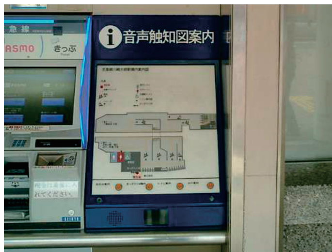
駅構内音声案内触知図