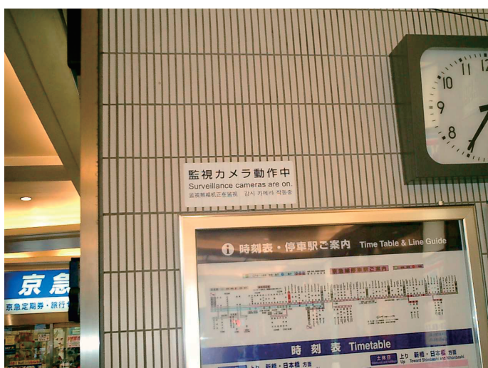
注意喚起ステッカー