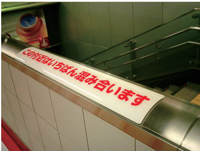
アクリル加工看板