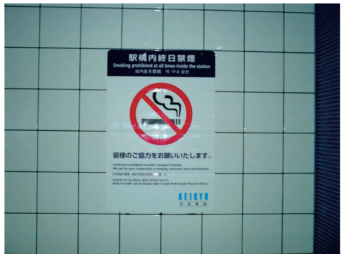
注意喚起ステッカー