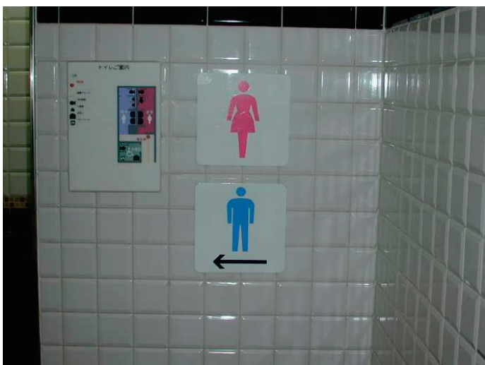
触知板・ピクトサイン